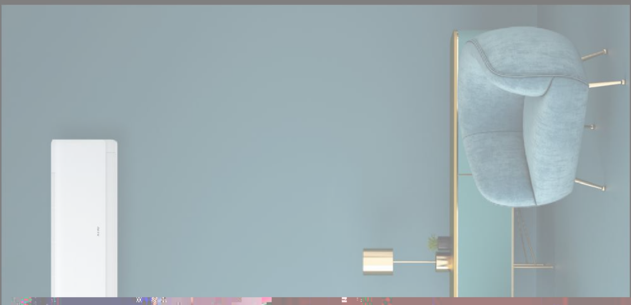
NOWY WYMIAR JAKOŚCI